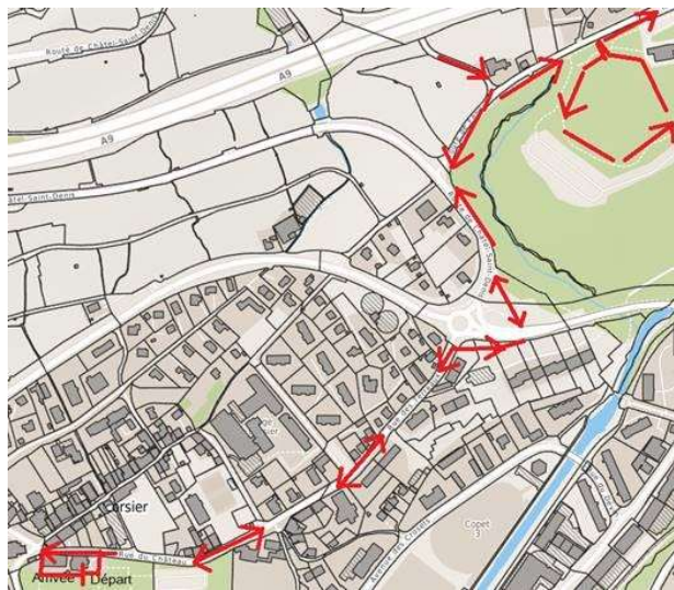
Parcours 11 kms bas